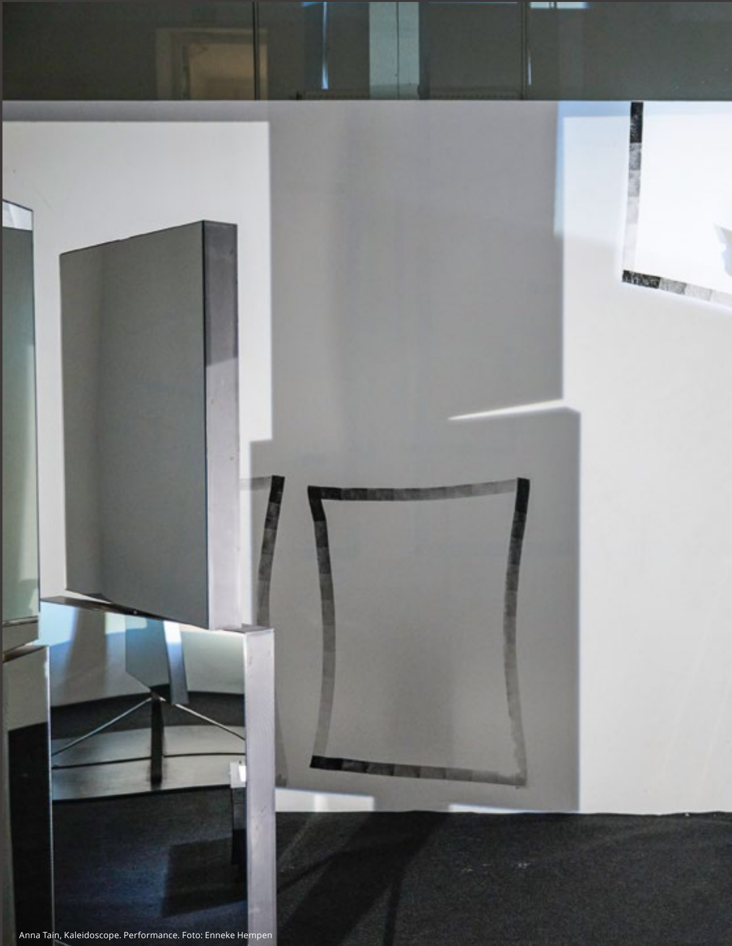
Anna Tain, Kaleidoscope. Performance.