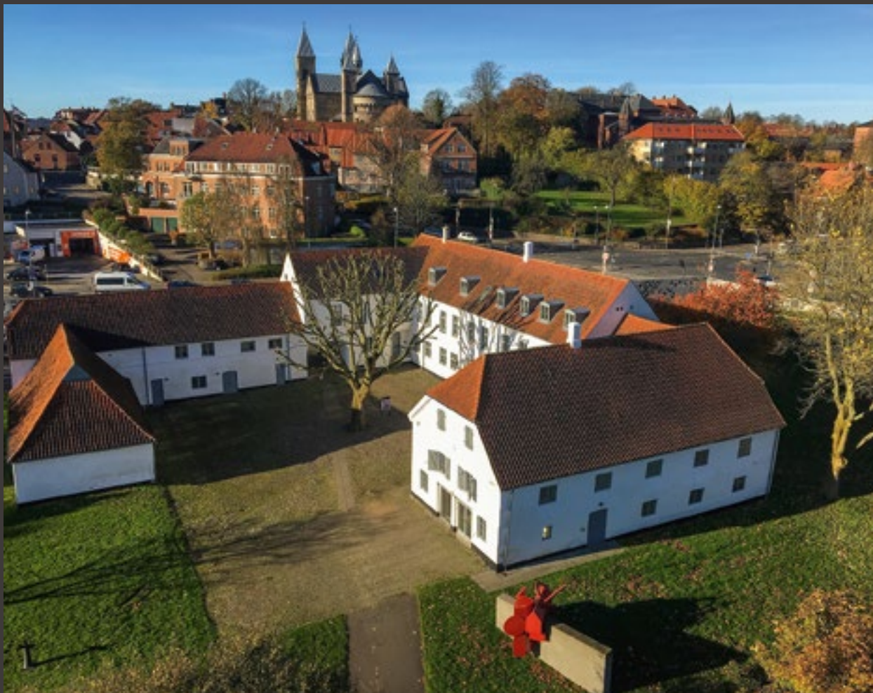
Viborg Kunsthall.