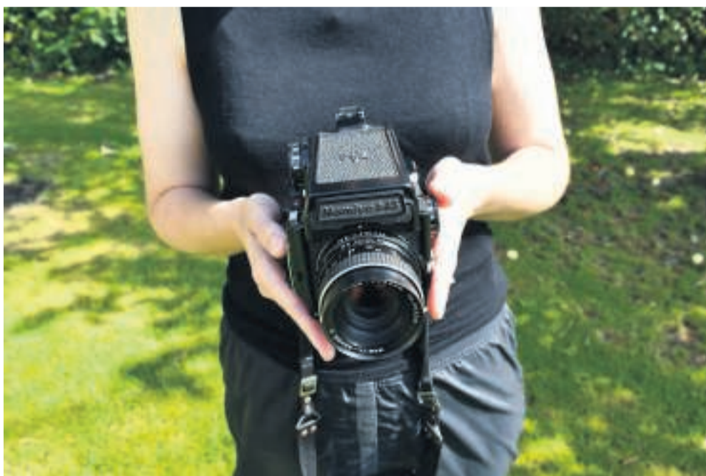
Hun har altid sit analogkamera under armen og elsker at dyrke den mere langsomme proces.

Hvilke kollektive og personlige overbevisninger og folkefortællinger har rod i Viborg? Det undersøger den franske fotograf og forelægger Siouzie Albiach i nyt kunstprojekt, der skal skildre vores arv og kultur, og hun vil gerne have dig med!