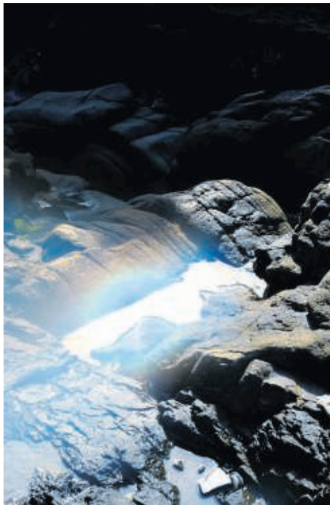
Førhen har hun bare taget sit analogkamera under armen og bevæget sig ud i isolerede områder og lavet sine narrativer fra bunden, men denne gang vil hun gerne i kontakt med folk og lytte til deres historier.