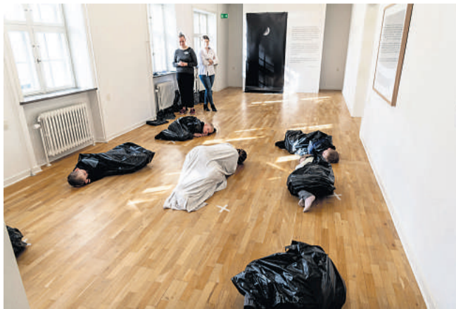
Eleverne skulle have vist, hvad de havde lært, til en forestilling i sidste uge. Men grundet corona-virus blev det i første omgang udskudt.