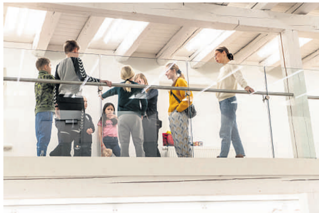
Undervisningen foregik på Viborg Kunsthøi i anledning af Billedkunstens Dag.