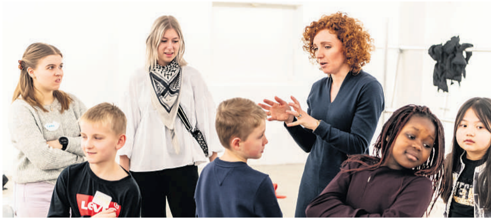
Det var HF-fagpakken Kunst og design, der stod for dagens undervisning.

3.a fra Houlkærskolen fik sidste onsdag alternativ undervisning, da elever fra Viborg Gymnasium & HF lærte børnene små performances.