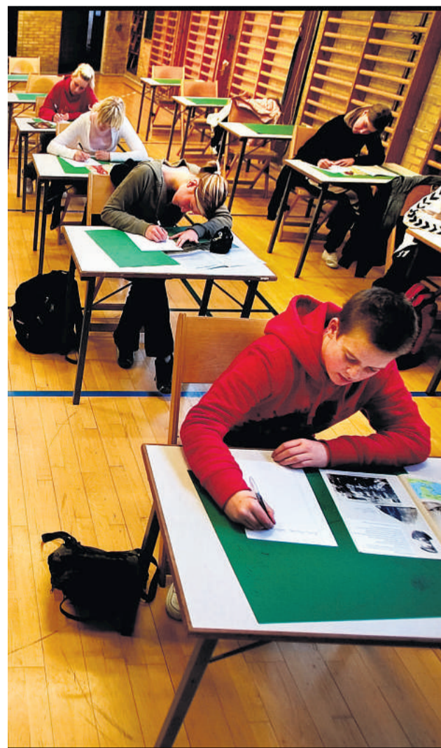
Eleverne fra Viborg har knækket matematik-koden. Arkivfoto.

Ifølge politiets oplysninger har de syv partikelfiltre og syv katalysatorer en samlet værdi på 70.000 kroner. /ISKEL