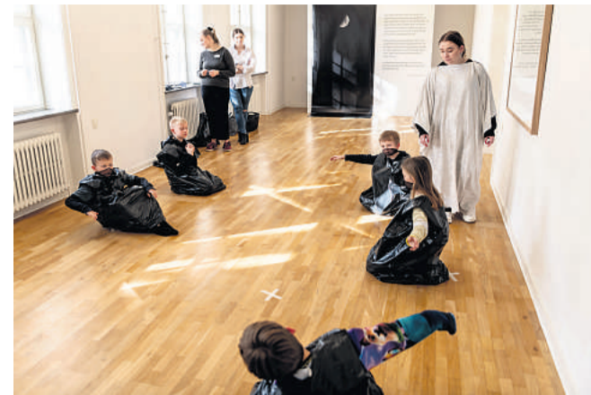
Børnene syntes, de lignede alt fra ninjæer til ørkenrøvere i kostumerne.