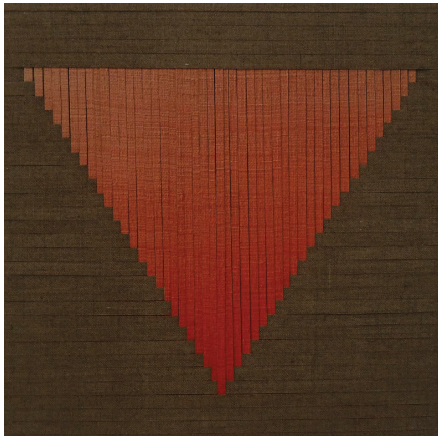
Ditte Ejlerskov: "Red Triangle Weave", 2019. Olie på to sammensyede lærreder.

Viborg Kunsthall er indrettet således, at det er muligt at opbygge to udstillinger, som fungerer uafhængigt af hinanden. Ikke desto