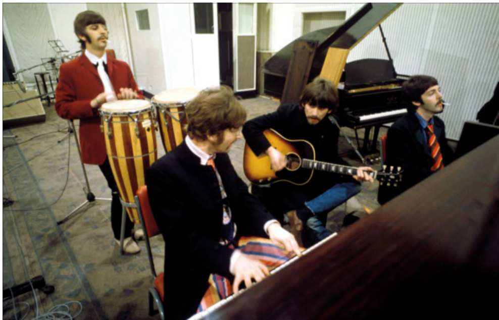
The Beatles-medlemmerne kedede sig tydeligvis aldrig, når de indspillede julehilsnerne til fanskaren.

Det er første gang, at de syv julehilsner, der blev indspillet fra 1963 til 1969, udkommer som vinylsingler og i en boks, hvor historien om udgivelserne bliver godt fortalt. Oprindeligt blev hver julehilsen udsendt en dag i december på en flexi-disc, som er en papirtynd skive. Og selv om dette pud-