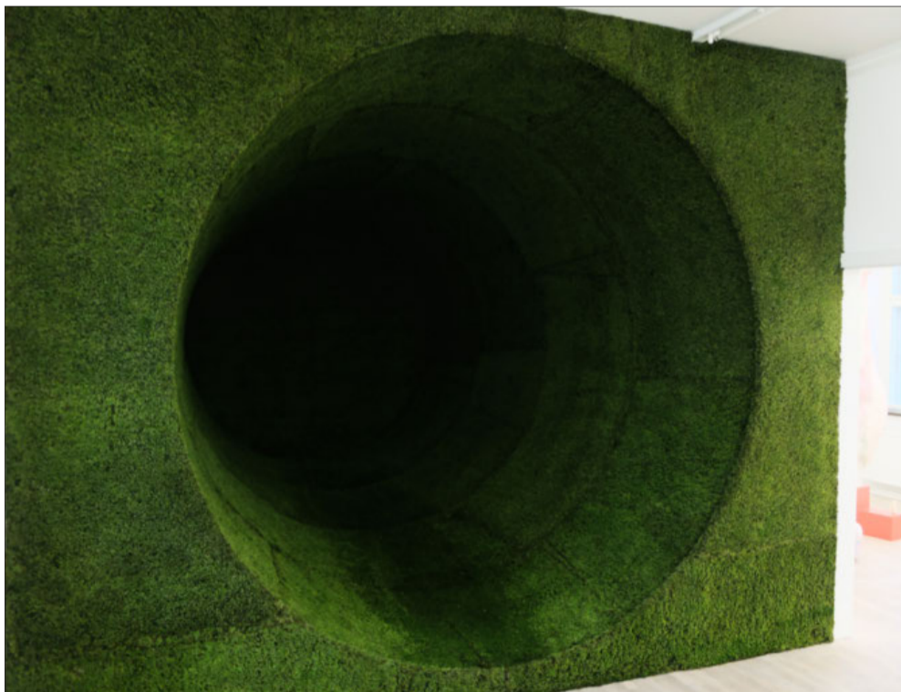
Marianne Jørgensen: "Green Dark", 2017. Træ og mos.

En af de udstillende kunstnere har faktisk gennem de seneste år på aldeles fremragende vis udfordret de tre dimensioner gang på gang, og det er da også Marianne Jørgensen, der er op-havskvinde til det ubetinget mest fængslende kunstværk på den aktuelle udstilling. Udgangspunktet er en