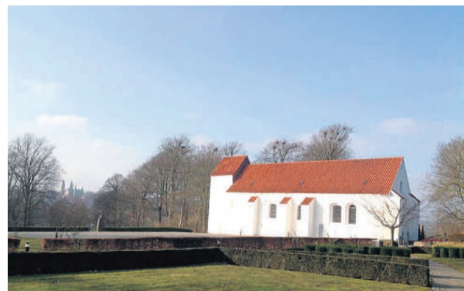
Asmild Kirke er ramme om en sangaften med forårssange på repertoire. Pressefoto