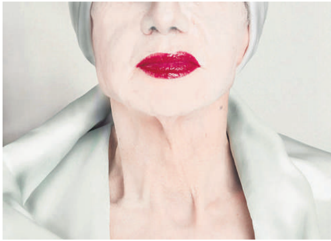
Fotografen Erwin Blumenfeld tog et billede som dette til modemagasinet Vogue i 1952. Catherine Balet har taget det samme motiv - men med modellen Richardo.