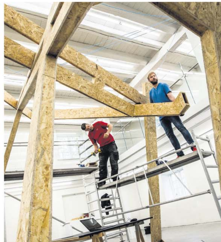
Skulpturen er også en balancekunst. Den skulle helst ikke tippe - som visse andre norske naturfænomener.

»Da kunstnerne flyttede ind, vidste de ikke nøjagtig, hvordan værket skulle se ud. Først da de kunne leve sig ind i stedet og møde boligens frivillige, tog tankerne form,«