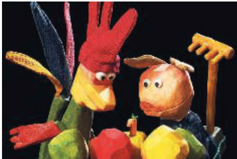
Billetter kan bestilles på viborgbib.dk eller på bibliotekerne i Viborg Kommune.