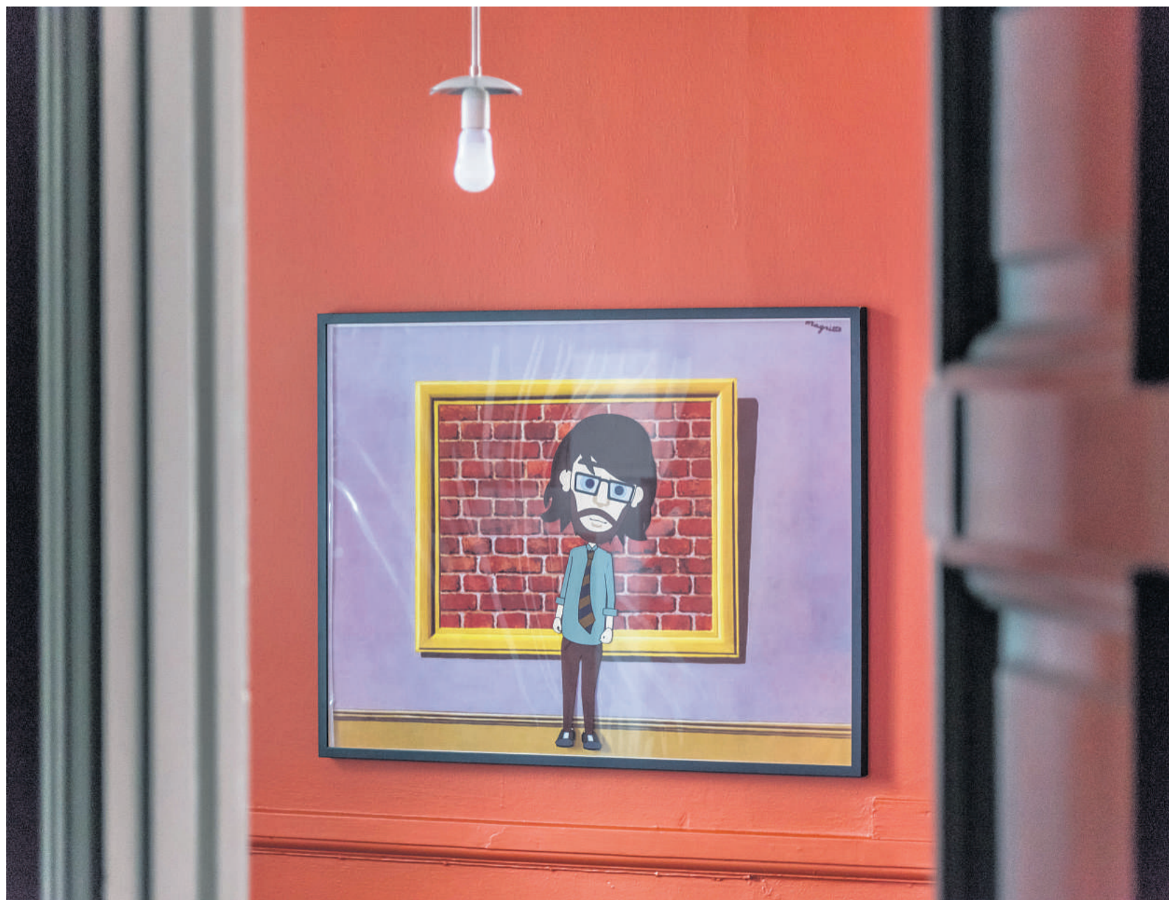
Udstillingen kommer frisk fra biennalen i Venedig og skal videre ud i den store verden, når den forlader Viborg.

Kunstneren trækker gæsten ind i en labyrint, der er ladet med fortælling. Fem tegnefilm er de vigtigste virkemidler. Den længste varer en time. Som i en retssag kommer argumenterne frem, og så er det op til gæsten at dømme. Da kunstneren i august be-