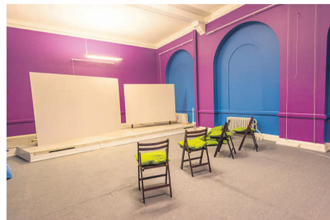
Typiske pangfarver fra tegnefilm pryder væggene. Kunsthallen har lovet at "male væggene tilbage".