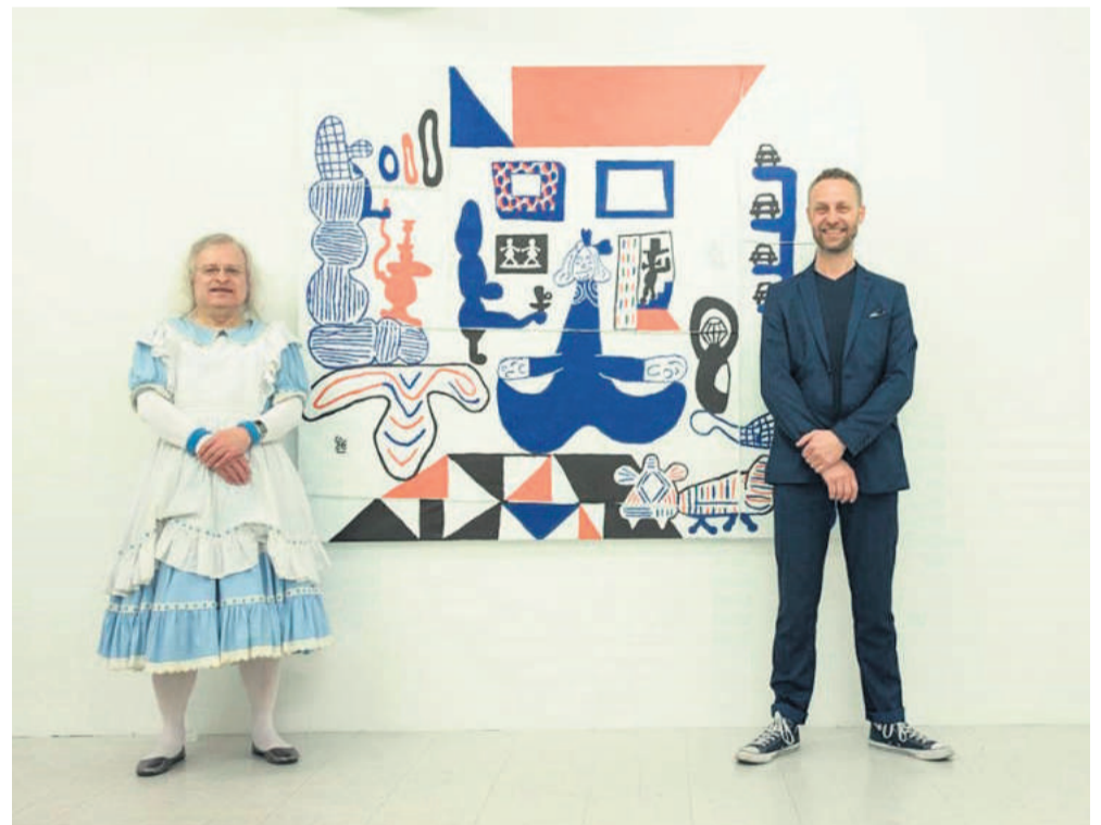
Kunstneren og Kjole Ole foran ét af kunstværkerne.

Her kan nævnes en slangebøsse ved "Boy" på Aros, en