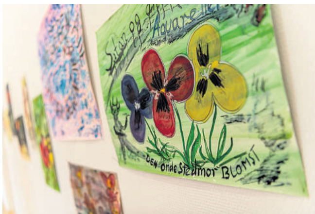
Et af koncepterne bag Schulenburgs akvareller er, at han ikke renser penslerne undervejs.