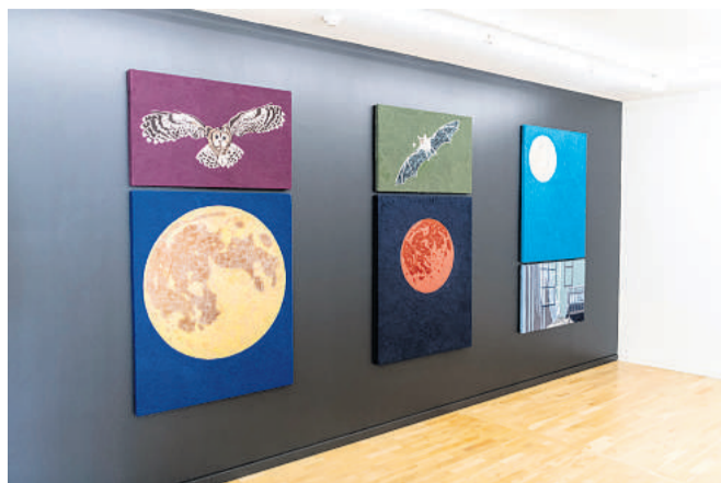
Detaljerne i felt-billederne er mange.