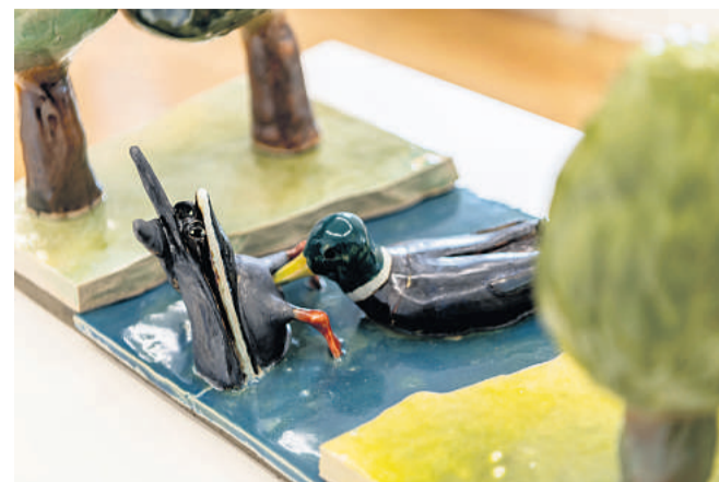
Andreas Schulenburgs værker er skabt i mange materialer fra keramik og felt til vandfarver og video.