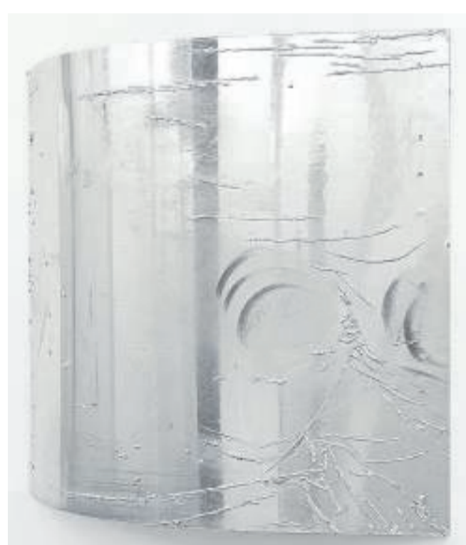
▲ På væggene rundt i rummet hænger nogle rektangulære værker, der mimer det store værk, ved at bue udad. Værkerne er beklædt med spejlfolie påført "autentiske" ridser.