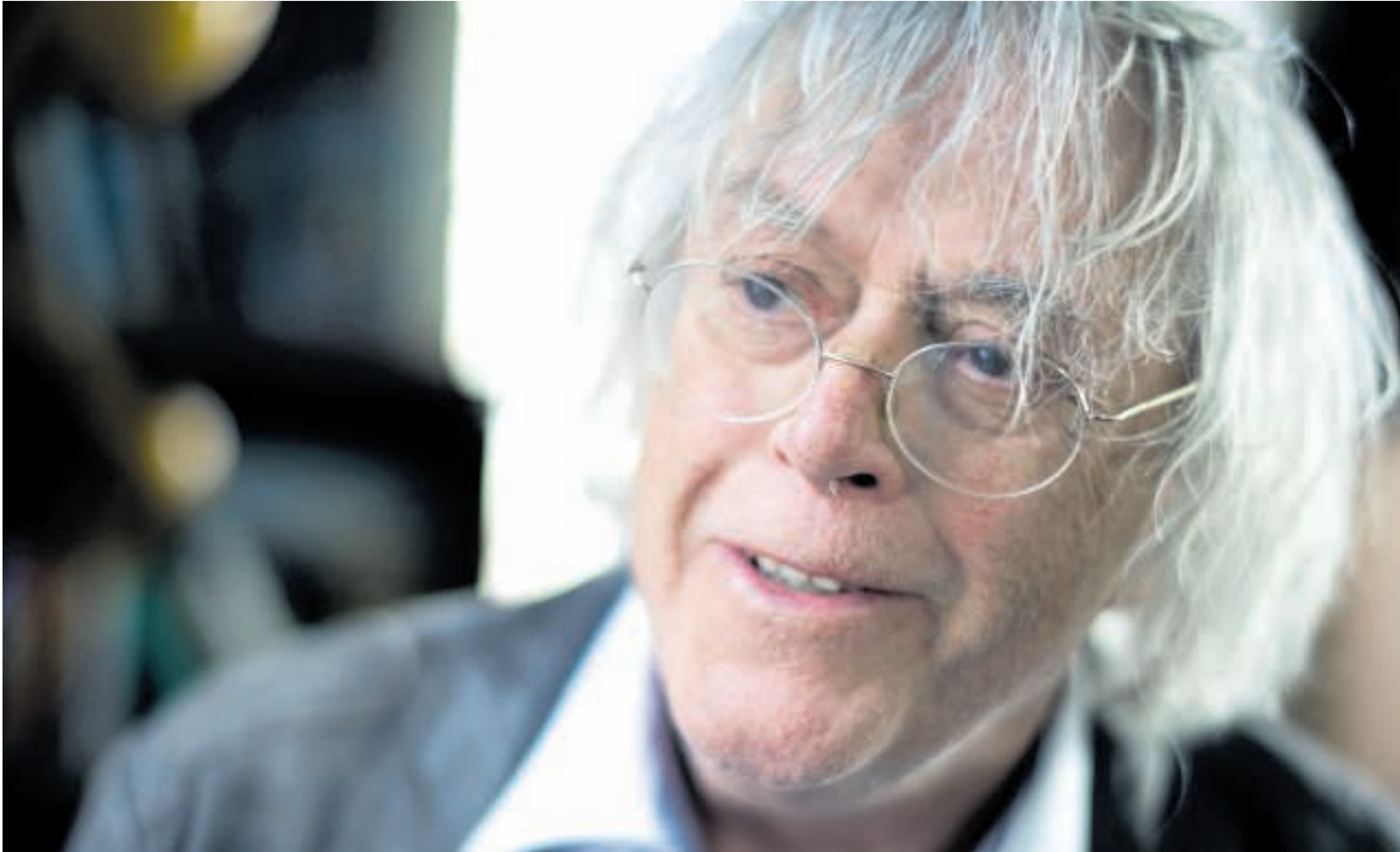
▲ Dag Solstads tørre, detaljefikserede og repetitive stil, og hans måde at strippe sin hovedperson på via den dækkede direkte tale afslører hovedpersonens – Bjørn Hansen – store forfængelighed.